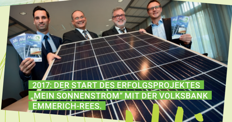
2017: DER START DES ERFOLGSPROJEKTES „MEIN SONNENSTROM“ MIT DER VOLKSBANK EMMERICH-REES.