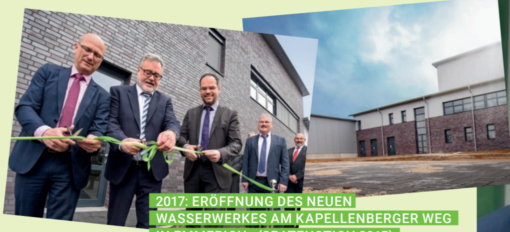
2017: ERÖFFNUNG DES NEUEN WASSERWERKES AM KAPELLENBERGER WEG IN EMMERICH. (SPATENSTICH 2015)