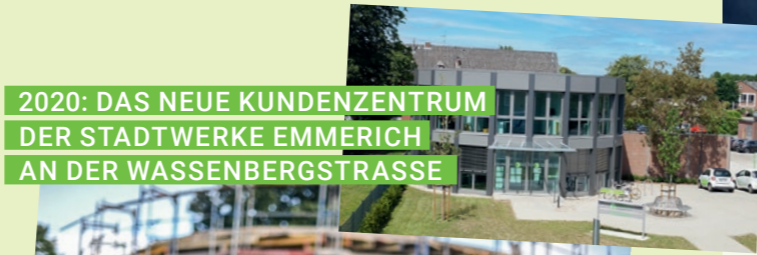
2020: DAS NEUE KUNDENZENTRUM DER STADTWERKE EMMERICH AN DER WASSENBERGSTRASSE