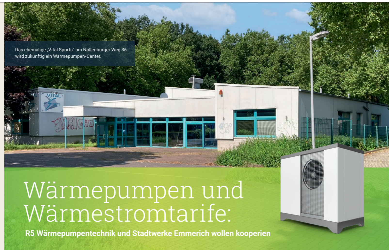
Das ehemalige „Vital Sports“ am Nollenburger Weg 36 wird zukünftig ein Wärmepumpen-Center.

Hinweis Die Entscheidung für die Verwendung des generischen Maskulinums in dieser Publikation beinhaltet keine Wertung. Es geht dabei um die deutlich bessere Lesbarkeit und Praktikabilität. Wenn nicht anders kenntlich gemacht, gelten entsprechende Personenbezeichnungen für alle Geschlechter.