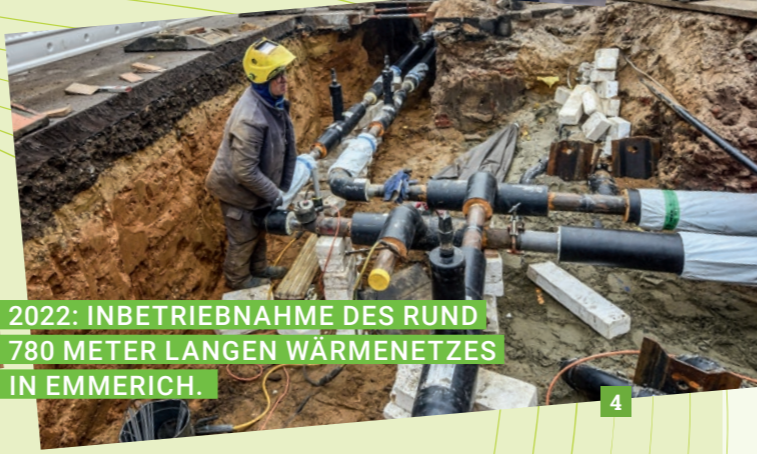
2022: INBETRIEBNAHME DES RUND 780 METER LANGEN WÄRMENETZES IN EMMERICH.