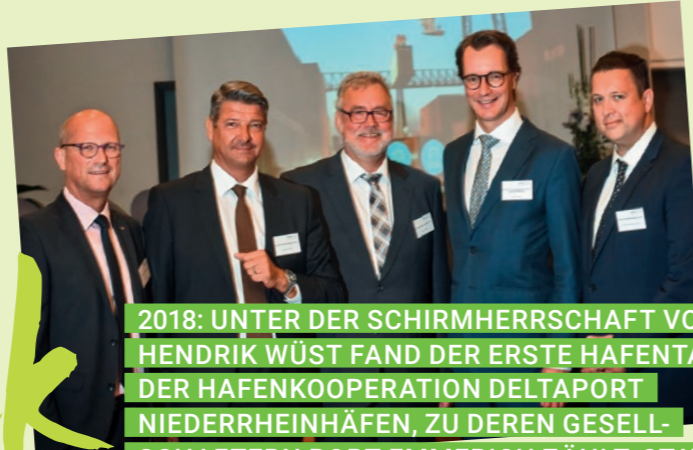
2018: UNTER DER SCHIRMHERRSCHAFT VON HENDRIK WÜST FAND DER ERSTE HAFENTAG DER HAFENKOOPERATION DELTAPORT NIEDERRHEINHÄFEN, ZU DEREN GESELLSCHAFTERN PORT EMMERICH ZÄHLT, STATT.