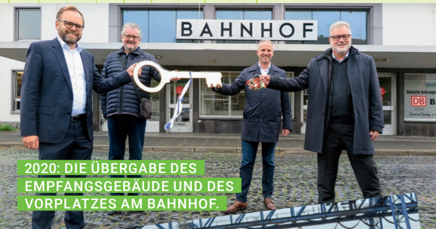
2020: DIE ÜBERGABE DES EMPFANGSGEBÄUDE UND DES VORPLATZES AM BAHNHOF.