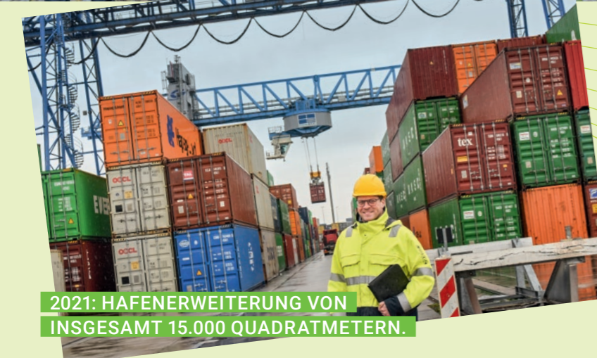
2021: HAFENERWEITERUNG VON INSGESAMT 15.000 QUADRATMETERN.