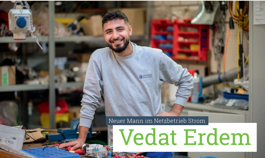
Neuer Mann im Netzbetrieb Strom